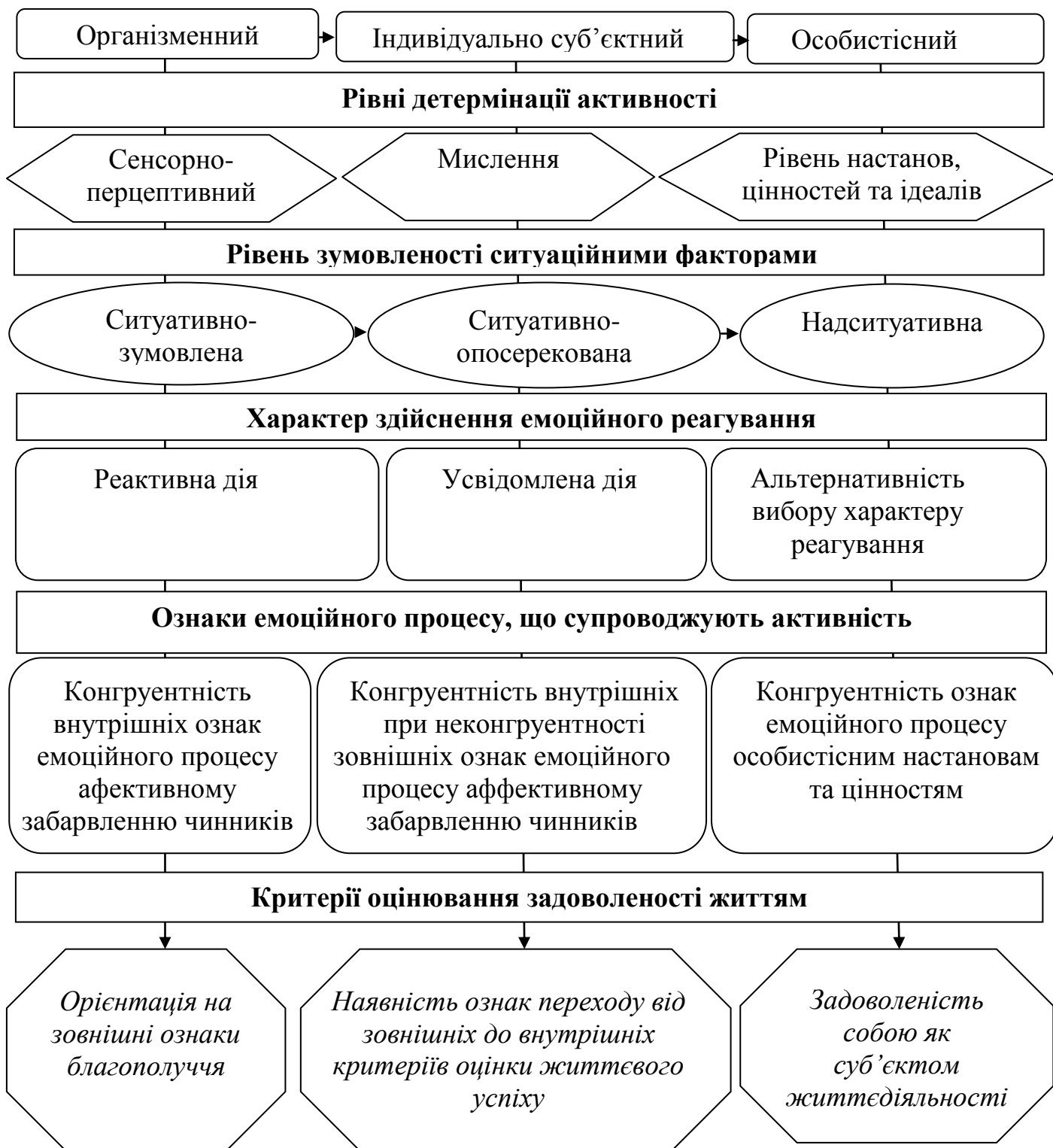
Рис. 1. Механізми впливу компонентів емоційного інтелекту на успішність вирішення провідних життєвих завдань

супроводжують, характером здійснення емоційного реагування та рівнем зумовленості активності ситуаційними факторами наочно представлено на рис. 1.